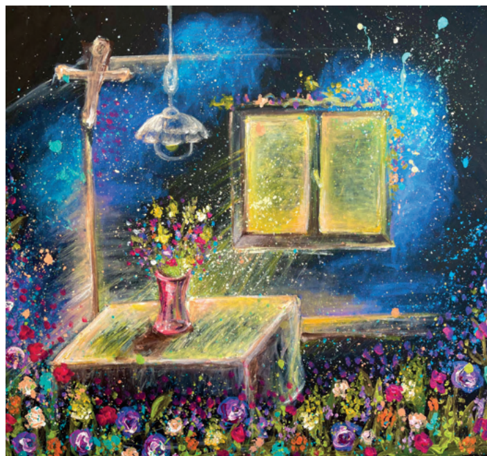
Autorka: Kamila Hájková, název díla: Moje Sudety

Když jsem poprvé slyšela název neziskovky, o které si budeme povídat, napadlo mě, že čeština je opravdu kouzelný jazyk. Je to organizace Ze mě Země, která otevřela v ČR téma „přírodního pohřbnictví“. Lidé příliš nevěděli, co si představit pod tímto pojmem. Povědomí o tom, že jde udělat „pohřeb jinak“, ve smyslu osobnější, a podle toho, co měl zesnulý rád, s větším zapojením celé rodiny i blízkých. Pohřbívání v souladu a s respektem k přírodě, bez plastových květin a věnců, pod širým nebem, třeba v recyklovatelné, papírové či proutěné urně.